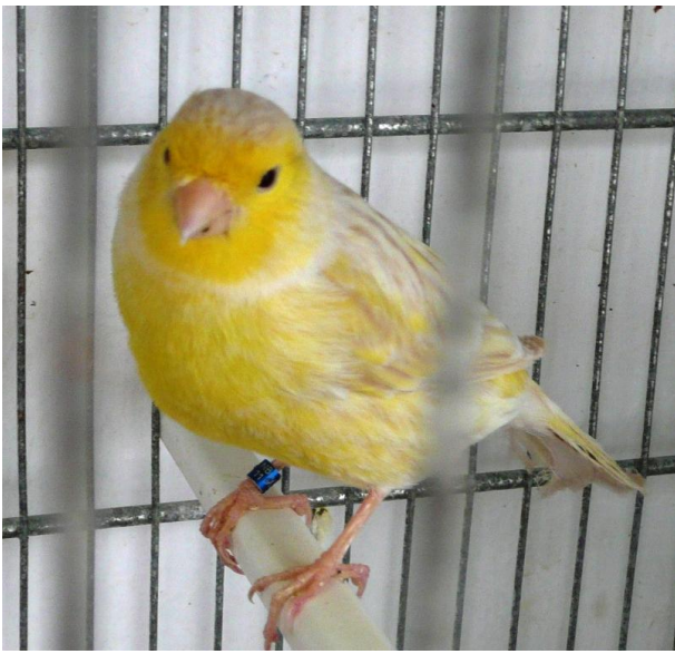
Satinet geel mozaiek man