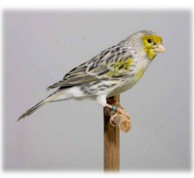
Agaat geel mozaiek man