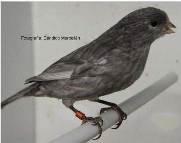
Zwart Jaspis wit